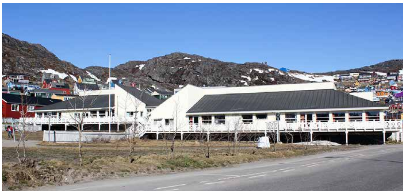
Alderdomshjemmet Ainarsivasik i Qaqortoq. Qaqortumiutoqqaat illuat Ainarsivasik.