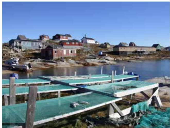
Tørrestativer til fisk i Qassimiut. Qassimiuni aalisakkanik panertitsiviit.

Men overordnet, i lyset af den offentlige sektor og de offentligt ejede virksomheders dominerende stilling i den grønlandske økonomi, vil en mere ligelig fordeling af Grønlands ressource- og indkomstgrundlag være nødvendig for en mere stabil udvikling i Kommune Kujalleq. Dette nationale fordelings spørgsmål vil fordrer en mere hensigtsmæssig fordeling af de offentlige arbejdspladser, således gennem udflytning af offentlige arbejdspladser til byerne udenfor Nuuk.