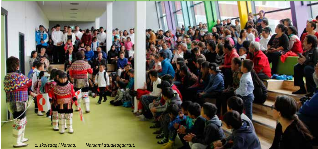
1. skoledag i Narsaq. Narsami atualeqqaartut.