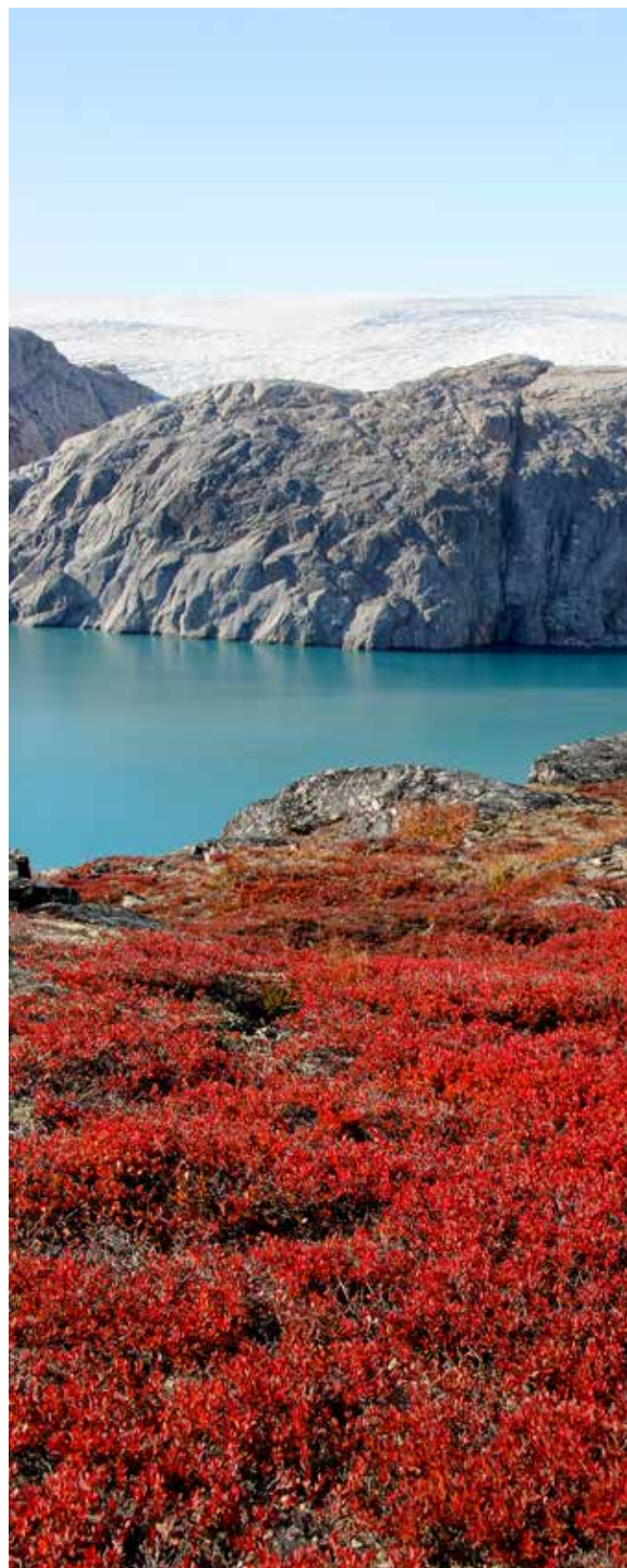
Foto: Efterårsfarver ved indlandsisen.

68 — Taphuse og andet vandforsyning: På denne konto var der kun et forbrug på 35,4 %. Det gælder for samtlige byer og bygder.