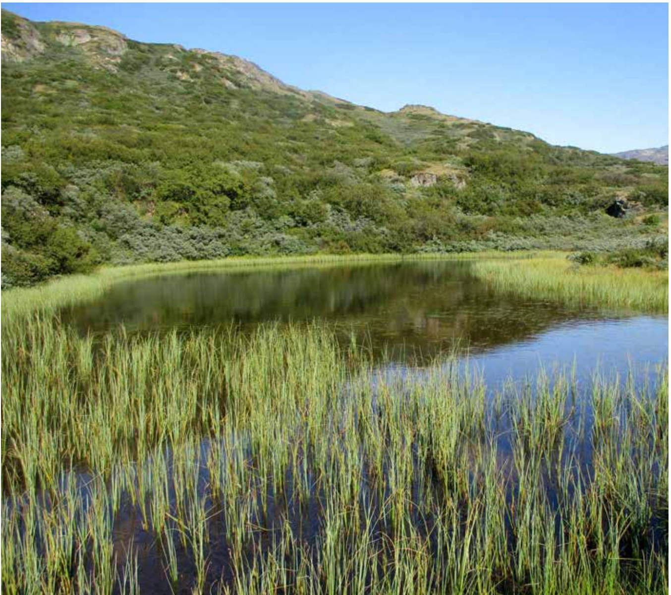
Foto: Lille sø ved Igaliku Kujalleq.

Overforbrug på ca. 2,8 mio. kr. ift. det oprindelige budget skyldes hovedsageligt opkrævning af nogle regninger af 2019 ifm. takstbetaling for anbringelser på døgninstitutioner og tab af 2 klagesager. Desuden har der været stigende behov for pleje og støtte på handicapområdet, både i personer eget hjem og i bofællesskaber. Socialforvaltningen har kontinuerlige udfordringer med rekruttering og fastholdelse af personaler på området.