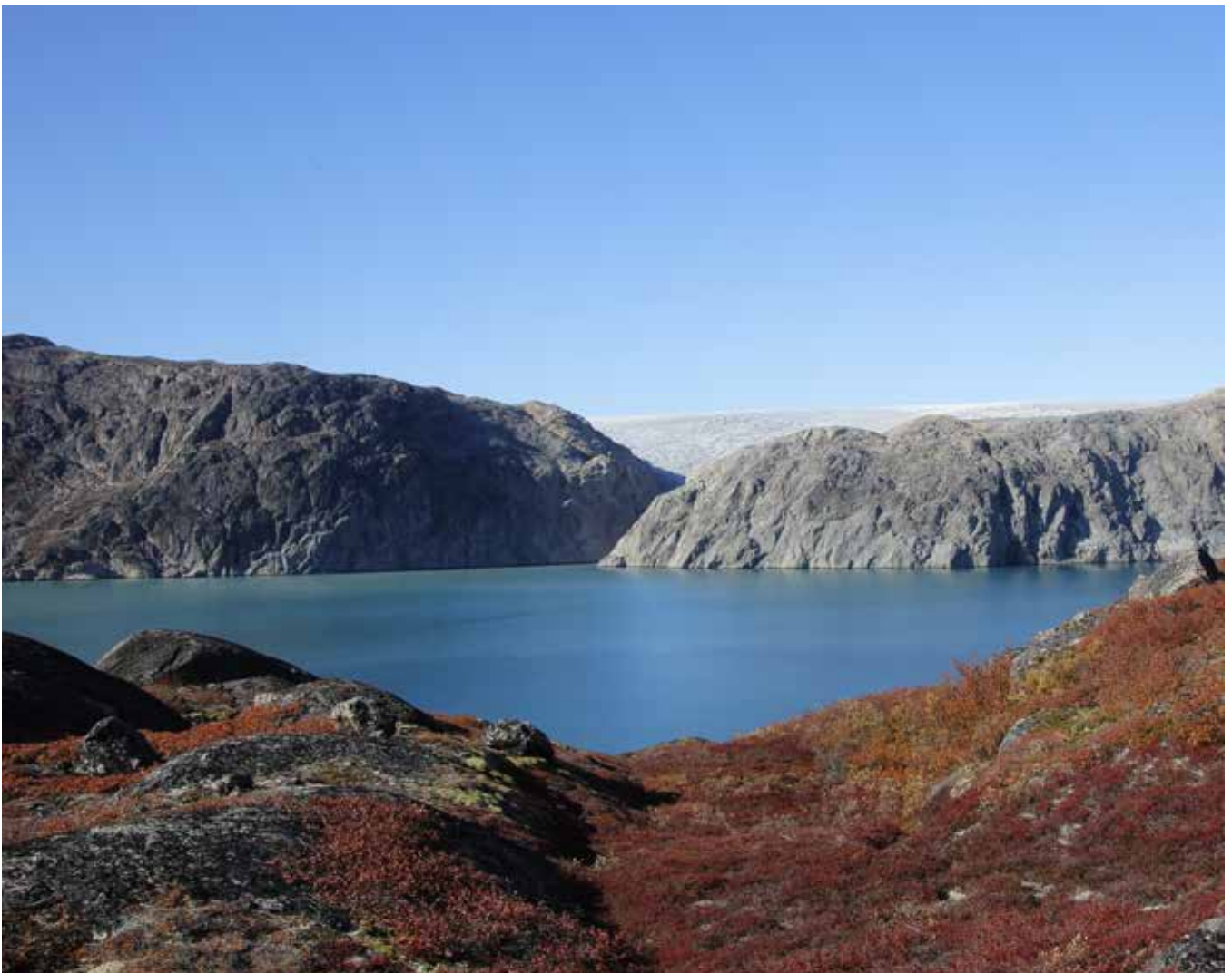
Foto: Fuglefjelde og indlandsisen øst fra tvillingebræ.

I begyndelsen af 2020 var likviditeten på 23,3 mio. kr. og på 23,6 mio. kr. ved årets udgang. Til trods for regnskabs negative resultat er likviditeten stabil, men presset vil starte i regnskabsåret 2021.